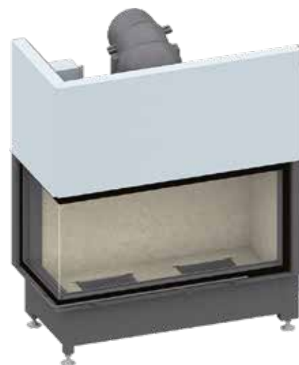
Ekko L 100(45) avec porte escamotable